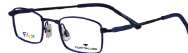
TOM TAILOR Kinderbrille